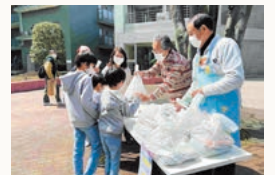
こども食堂(弁当配布) 東柏ヶ谷5丁目地区社協

みなさまからの会費が地域の福祉活動を支えています。 ご協力とご参加をお願いいたします。