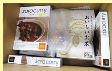
レトルトカレー＆お米セット