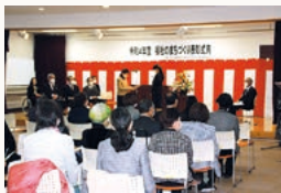
福祉のまちづくり表彰式典