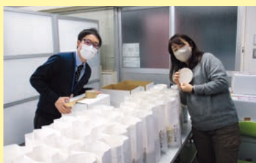
「笑顔が増えてくれるといいなあ」 梱包作業の様子